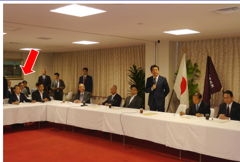
安倍総裁、二階幹事長など、党の執行部が集まり、選挙対策会議を開催。