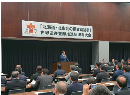
北東北の縄文遺跡群の世界遺産登録に向けて、関係自治体(4道県)の皆さんに激励の挨拶をする代議士。