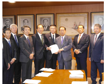
(与党・幹事長室で知事・市町村長さん たちと秋田の予算要望を行う)