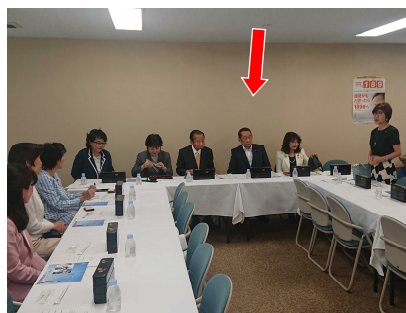
党の女性議員らと、その活躍に向けて、幹事長を交えて意見交換を行う代議士。