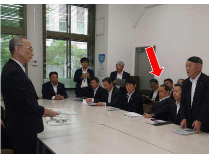
能代・大館・鹿角・北秋田市の県北各市町長らと、財務省の主計局長に、政策の要望を伝える代議士。