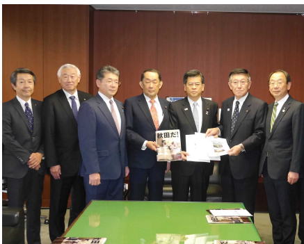
(秋田の課題が特に多い、 国土交通大臣に、市町村関係者を案内)