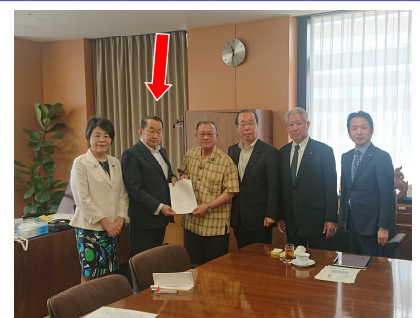
自民・公明の有志議員らと、司法・行政制度改革について担当の国務大臣と意見交換。