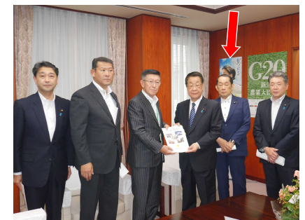
農林水産大臣に、秋田の農業と、農家の皆さんの暮らしを守るよう知事と要望。