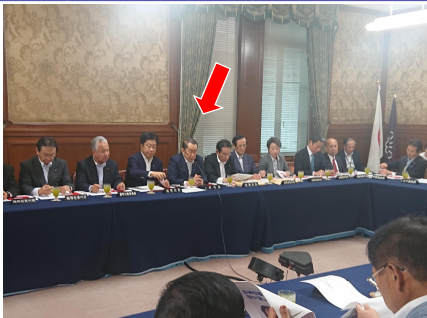
党総務会より。幹事長代理として、国会に提出される法案や、党運営を議論。