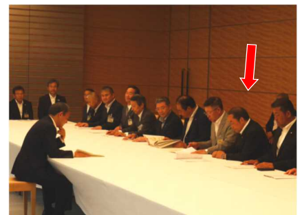
官邸会議室にて、県知事や市町村長らと、菅官房長官に、秋田の抱える課題を説明。