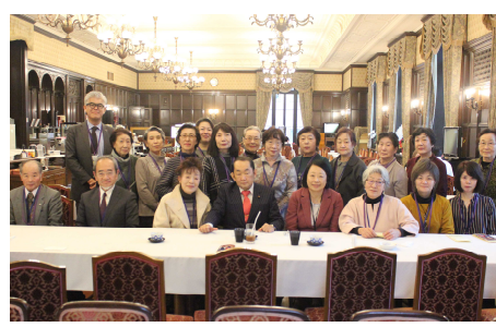
地元から国会見学に来られた皆さんと議事堂内で懇談。