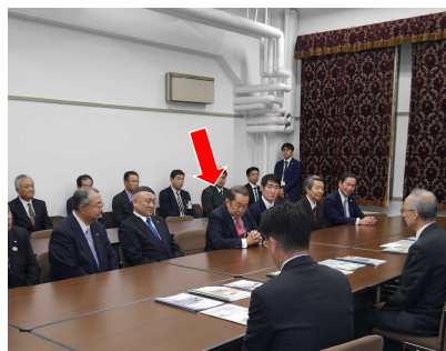
県北の首長や議員の皆さんと財務省主計局長に地元の要望を説明。