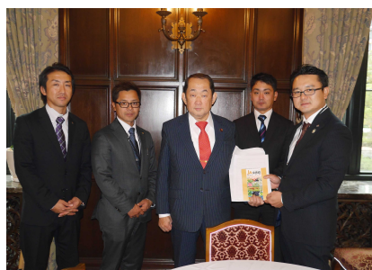
国会内で、県JA青年部の皆さんから秋田の農業の課題を意見交換。