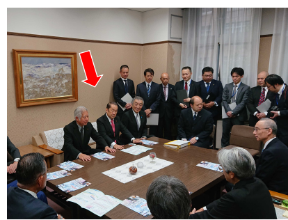
同志の国会議員らとともに、予算や税について要望。