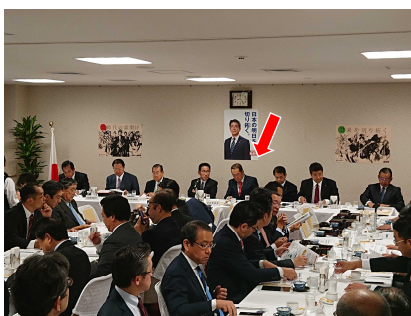
岸田政調会長とともに、経済・金融の情勢について早朝から勉強会。