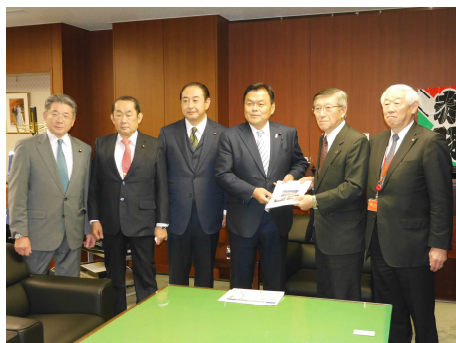
(秋田の課題が特に多い、国土交通大臣に、知事と市町村関係者を案内)