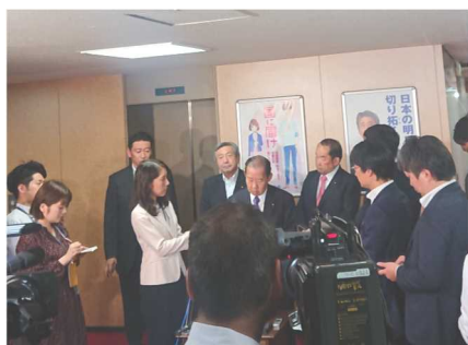
二階幹事長とともに、マスコミの記者会見に応じる代議士。