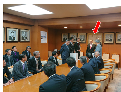
全国から来られた皆さんと、各地の要望について説明を受ける代議士。