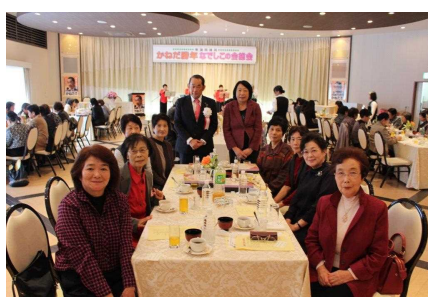
寸暇を惜しんで地元の皆様と交流。(代議士にとっては一番楽しいひと時)