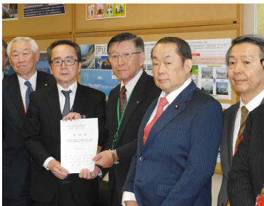
知事や市長、会議所会頭らと、秋田のインフラ整備について国交省幹部に要望。