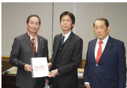
各市の市長らを案内し、総務省の黒田事務次官に特別交付税を要望。(写真は能代市長)