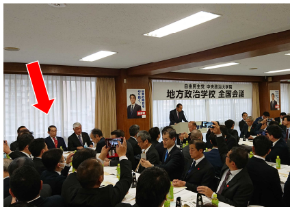
自民党の地方政治大学院において、各県連の幹部らと、地方政治の活性化について議論。