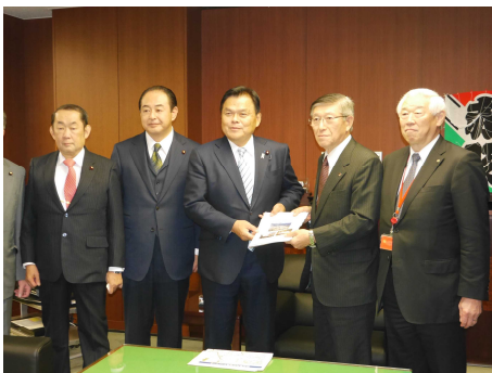
秋田の課題が特に多い、赤羽国土交通大臣に、 知事と市町村関係者を案内