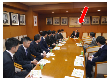
JA秋田青年部の皆さんと、党本部で意見交換。