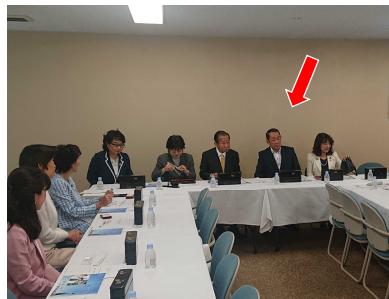
党の女性議員らと、女性活躍について幹事長と一緒に意見交換を行う代議士。